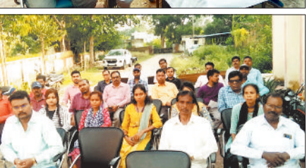
बैठक में उपस्थित विद्युत विभाग के अधिकारी कर्मचारी।