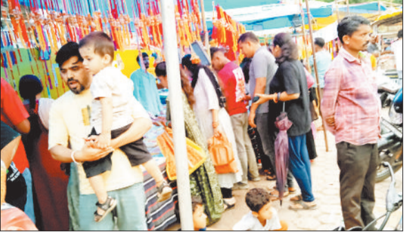
राखी दुकान में लगी लोगों की भीड़।