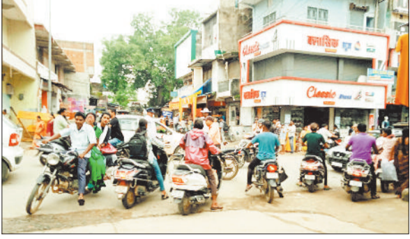
शहर में जाम ट्रैफिक।